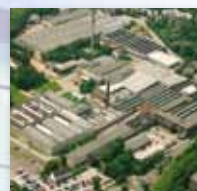
BKS GmbH, D-42549 Velbert