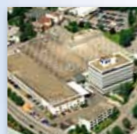
Gretsch-Unitas GmbH Baubeschläge, D-71254 Ditzingen