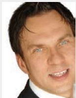
Ebert, Steffen; GIT SICHERHEIT – Wiley-VCH Verlag GmbH & Co. KGaA, Weinheim; Publishing Director