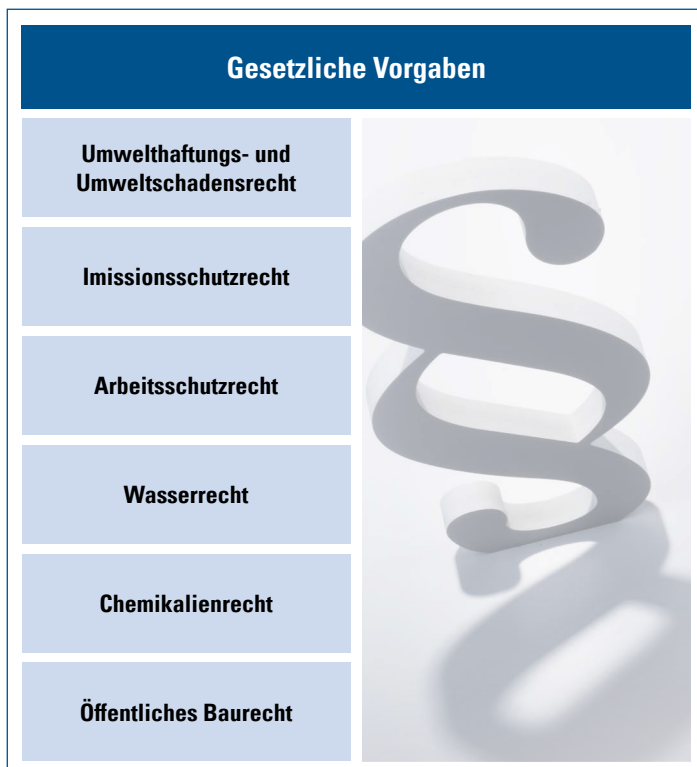
Schema Gesetzliche Vorgaben

Ebenso kann von einem Gefahrstofflager grundsätzlich die Gefahr ausgehen, einen Gewässerschaden herbeizuführen – im haftungsrechtlichen Sinne handelt es sich daher um eine Anlage nach dem Wasserhaushaltsgesetz (WHG-Anlage). Dies bedingt die Berücksichtigung der Vorgaben aus der Verordnung über Anlagen zum Umgang mit wassergefährdenden Stoffen (AwSV). Darin werden voraussichtlich Ende 2021 auch Löschwasser-Rückhalteanlagen vorgeschrieben, die bis Ende 2019 noch in der Bauordnung zu finden waren.